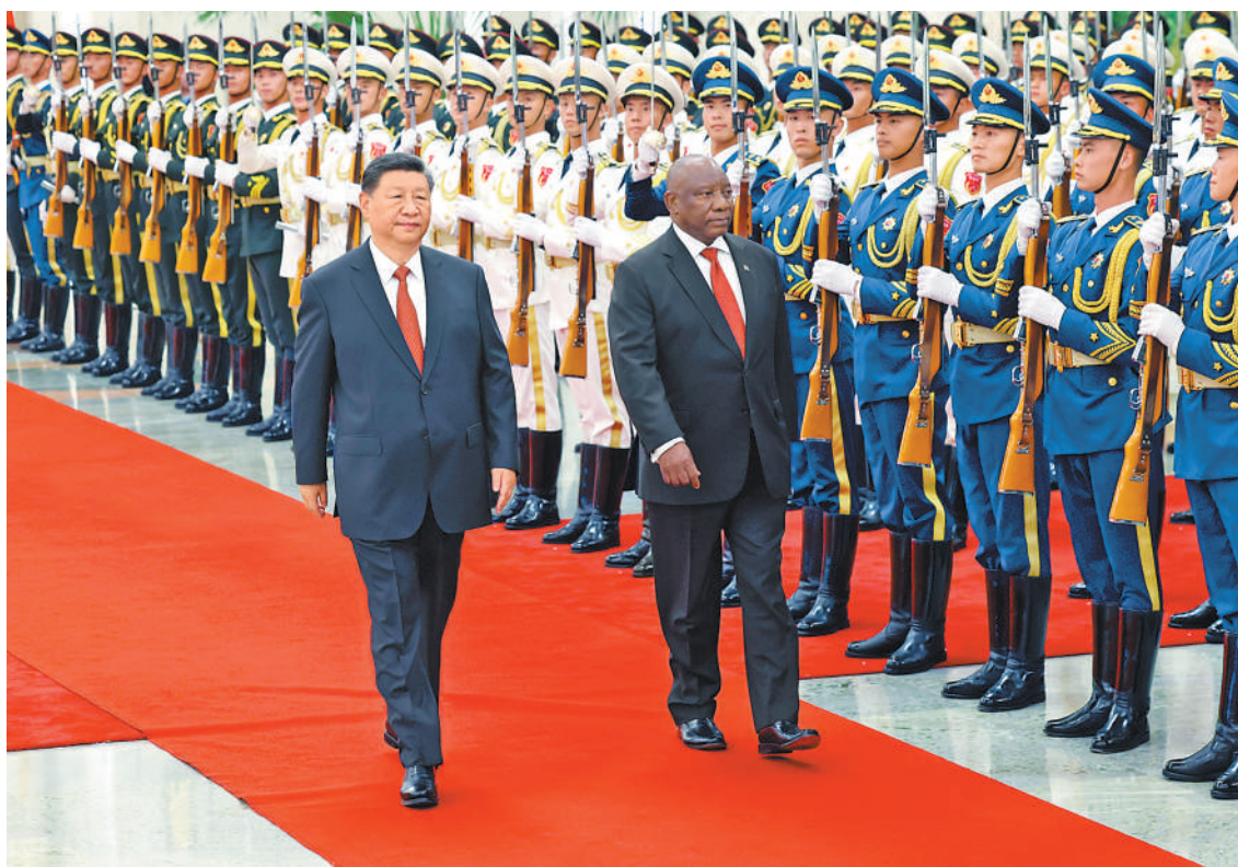
九月二日下午，国家主席习近平在北京人民大会堂同来华出席中非合作论坛北京峰会并进行国事访问的南非总统拉马福萨举行会谈。